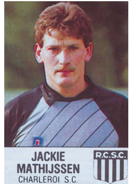
Devinez qui arrive au Sporting en 1985...

Les Zèbres remportent un tour final d'enfer et retrouvent la division I.