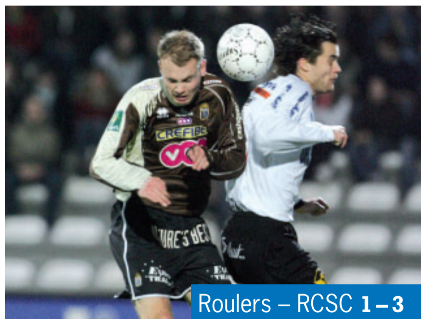
Roulers – RCSC 1 - 3

Les mêmes 22 acteurs remontèrent sur le terrain et, dès la 53 e , Christ alerta Sierens, mais la frappe fut contrée par Monteyne. Orlando suivit mais plaça le cuir quelques centimètres à peine à côté du but. À la 54 e , Dufoor donna un coup de poing dans le visage de Ciman, mais l'arbitre ne vit rien et laissa jouer malgré les contestations carolos bien légitimes. À la 57 e , Defays fit l'effort sur le flanc droit et centra vers Perbet.