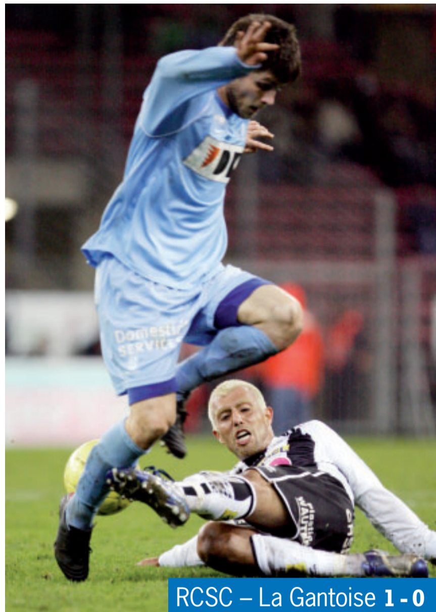
RCSC – La Gantoise 1 - 0